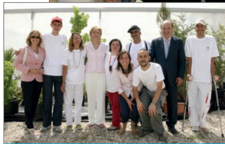
En imágenes, dos momentos de la visita posterior a la inauguración oficial de las instalaciones

El pasado 18 de mayo, y ante el Alcalde de Las Rozas, la Fundación Trébol y empresarios de la zona noroeste de la Comunidad de Madrid firmaron un convenio para potenciar la integración social y laboral de las personas con discapacidad