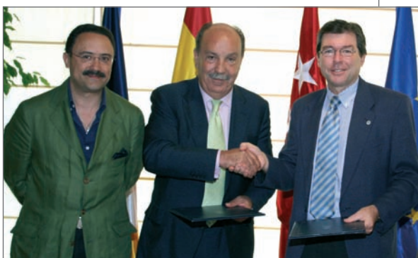
De izquierda a derecha, el Concejal de Economía y Empleo, el Alcalde de Las Rozas y el director del GIPIPT

Para mayor información contactar con Concejalía de Economía y Empleo del Ayuntamiento de Las Rozas