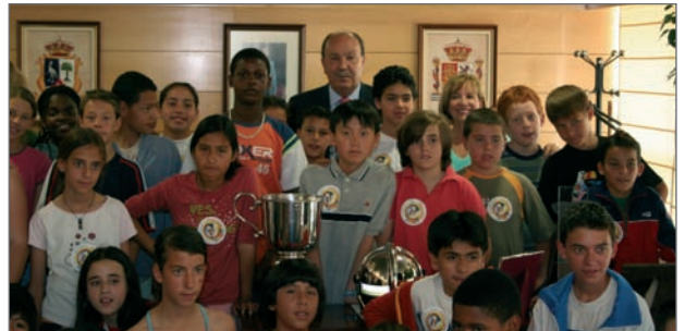
El Alcalde y la Concejala de Relaciones Institucionales posan con uno de los grupos escolares

La Campaña contó con la estrecha colaboración de la Concejalía de Educación.