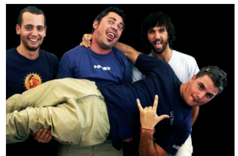
El Canto del Loco actuará el 30 de septiembre en el campo de fútbol de Navalcarbón

Por otra parte, del 6 al 15 de octubre, nada más finalizar las Fiestas Patronales dará comienzo la Feria del Marisco de Las Rozas en el Recinto Ferial. La entrada es gratuita.