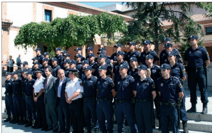
Los 39 agentes de la BESCAM recién incorporados en una fotografía junto al Alcalde de Las Rozas, el Concejal de Seguridad y el jefe de policía

El proceso ha sido concienzudo, ya que han tenido que aprobar un curso de seis meses de duración en el Instituto Superior de Estudios de Seguridad (ISES) para completar su formación física, jurídica y técnica, al que siguió un periodo de tres meses de prácticas en Las Rozas junto a agentes veteranos.